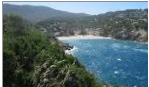
El cuerpo del joven ha sido hallado en Cala Vadella

La esposa de uno de los fallecidos avisaba esta pasada madrugada al 112 preocupada por el retraso de sus familiares , que habían salido a navegar a las 6 de la tarde y que tenían previsto regresar sobre las 9 de la pasada noche. Los pescadores tampoco contestaron en ningún momento a las llamadas efectuadas a sus móviles.