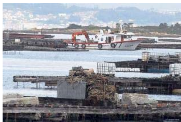
Los cálculos de algunos productores dicen que la cantidad de cuerdas ilegales existente equivale a más de 600 bateas sin concesión.

MANUEL MÉNDEZ - AROUSA La Consellería do Mar ha decidido intensificar los controles para evitar la existencia de bateas ilegales en las rías gallegas. Lo hace porque cada parque de cultivo está autorizado por ley para colgar hasta un máximo de 500 cuerdas de mejillón, y sin embargo son muchos los que sobrepasan esa cifra, algunos rondando incluso las 700 cuerdas por vivero. Y eso no es todo, pues se dan casos de cuerdas de producción o recolección de mejilla que no tienen los 12 metros de largo permitidos, sino que pueden alcanzar los 14 metros de profundidad, con lo que esto supone de producción añadida y por tanto ilegal.