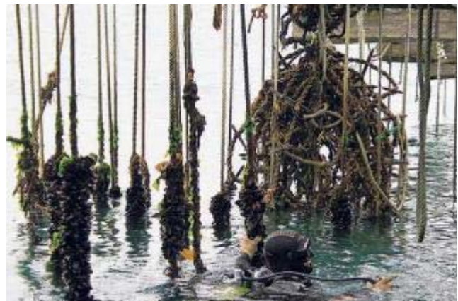
Imagen en la que se observan las cuerdas de una batea. Muñiz

A una media de 75 toneladas por vivero puede indicarse que de manera ilegal podrían producirse al año unos 45 millones de kilos de un mejillón que, obtenidos de forma clandestina y en competencia directa con el cultivado en las bateas que sí son legales.